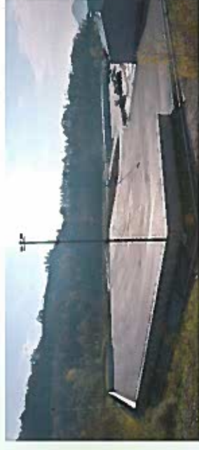
Obrat za sprejem in predelavo nenevarnih gradbenih odpadkov.

ustrezno odvodnjavanje. Poskrbeli smo za skladiščenje odpadkov pred predelavo in za produkte po predelavi. Investirali smo tudi v razsvetljavo, stroje za predelavo in kontejnerje za materiale, ki se dostavljajo v reciklažo ali sežig idr. Letna kapaciteta obrata za predelavo je 30.000 ton. Večja količina gradbenih odpadkov se lahko v obrat za predelavo odda proti plačilu, manjšo količino, do 1 m 3 , pa je možno oddati brezplačno. Predelani gradbeni odpadki se nadalje uporabijo za ponovno mešanje v betone v cestogradnji, za športna igrišča in sprehajalne steze, za razne zasipe cest, kanalizacije, bankine, za rekultiviranje gradbenih ali degradiranih površin, za obložni kamen, kot dodatek pri proizvodnji betona in drugo.