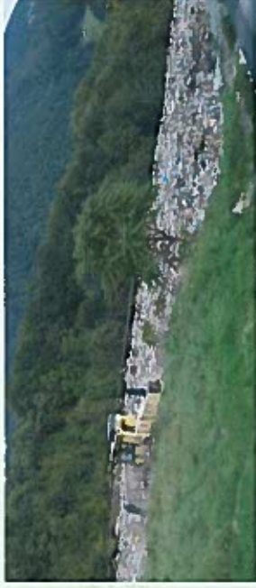
Priprava tretjega odlagalnega polja.

Razširili smo kapacitete odlagališča nenevarnih odpadkov s tretjim odlagalnim poljem . Zaradi spremembe zakonodaje se je prvotna kapaciteta tretjega odlagalnega polja z 240.000 kubičnih metrov zmanjšala na 200.000 kubičnih metrov. Ta kapaciteta odlagališča bo zadostovala vsaj za nadaljnjih 20 let. Odlagali se bodo samo predhodno obdelani ostanki odpadkov po sortiranju. Hkrati je bila zgrajena nova čistilna naprava za izcedne vode iz odlagališča, s čimer bo zagotovljeno doseganje predpisanih parametrov za izpust očiščene vode v vodotok.